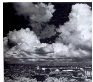
災害の要因となる入道雲の動きなどを見逃さない