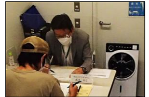
実際の相談の様子