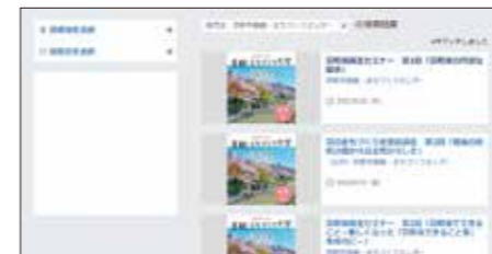
申込受付中の講座一覧ページ(イメージ)