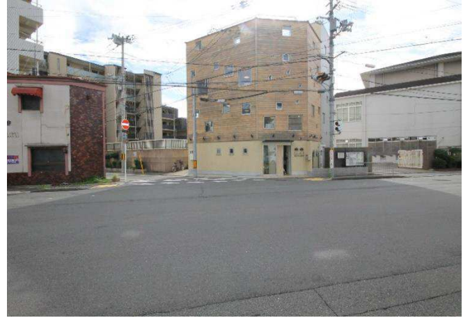
朱雀みぎわ学童保育所