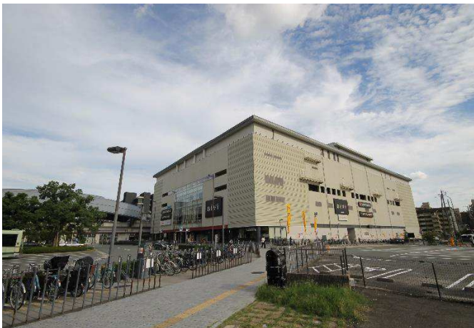
B i V i（映画館等複合商業施設）