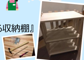
「収納棚のイメージ」