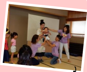
「ビニール袋でオムツデモンストレーション」の様子