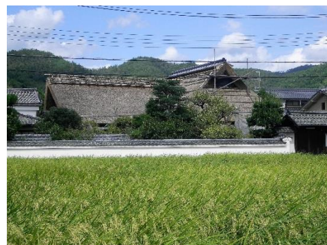
山崎家（旧井上家） 外観

※ 「山崎家（旧井上家）」の修理・改修工事は、木造住宅の耐震化支援制度、景観重要建造物の修理等助成制度、“京都を彩る建物や庭園”助成制度が活用され、今後、指定京町家改修補助金の活用も予定されています。