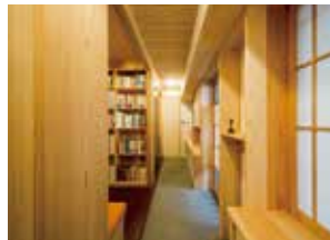
※第35回住まいのリフォームコンクール 「国土交通大臣賞」受賞

京町家の知恵を取り入れたマンションリフォーム、「中京・風の舎」*の実例を紹介。子育て世帯からシニア世帯まで、家族の成長や暮らしの変化に対応した『生涯快適』なすまいづくりのヒントや体験秘話をお伝えします。