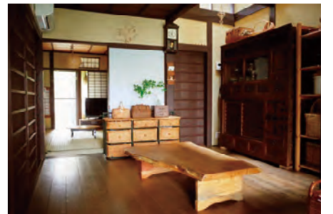
築約100年の京町家の内装

手づくりのものに囲まれ、ほんのり丁寧な暮らしを提案されている京町家居住者を講師に迎え、京町家暮らしの悲喜こもごも、季節や自然を肌感覚で味わうことから生まれる住みこなし術をご紹介します。